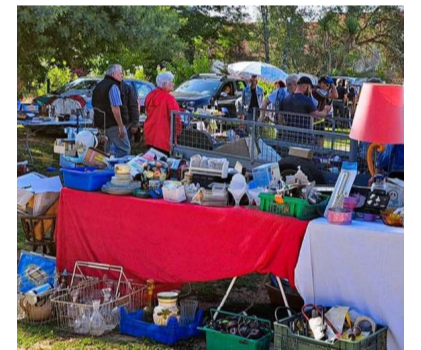
La place du Marché recevra le vide-greniers. M.-C. W.

Pour le bien-être de chacun, il est rappelé que les chiens, même tenus en laisse, sont interdits dans les allées du vide-greniers/brocante.