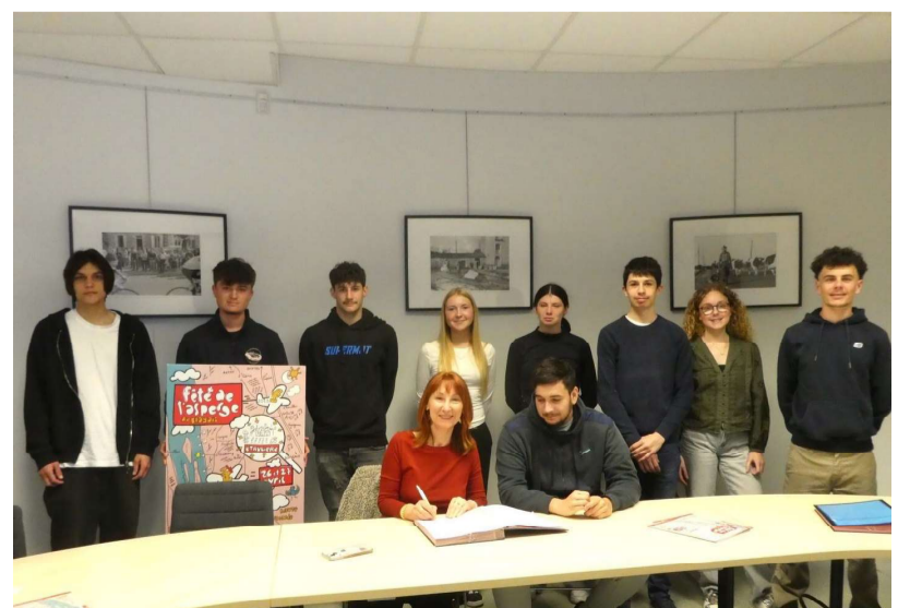
Signature d'un premier contrat de travail pour Les Asparagus. P. R.