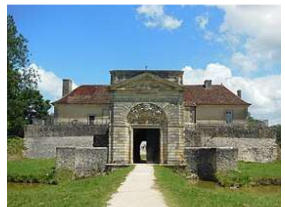
Cussac-Fort-Médoc, la Porte Royale, troisième site du Verrou de l'Estuaire avec le Fort Pâté et la Citadelle de Blaye

Aneut, le verrou avec Pâté, Cussac et la Citadelle est kiassé t-au patrimoine mondial de l'UNESCO