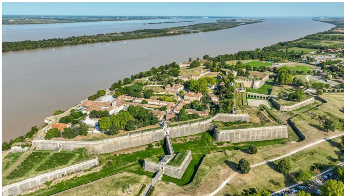
La Citadelle de Blaye, thieu de l'Estuaire de la Gironde, site historique le mé important dau Pays Gabaye (classé UNESCO)

Deus ouvrajhes de référence pour meu qu'naitre le gabaye