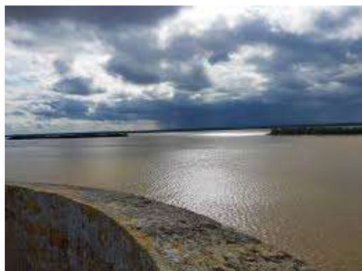
L'Estuaire de la Gironde, le mé grand estuaire de l'Europe à l'oués dau Pays Gabaye

Peur abouter, le Pays Gabaye, olé la veugne et le vin, les vins de Blaye, de Bourg, Fronsac, Pomerol. Et l'pineau fait avec dau cognat qui at chet de la citarne à Fraudat. Faut pas zou dire, les Gabelous peuraient n-entend'.