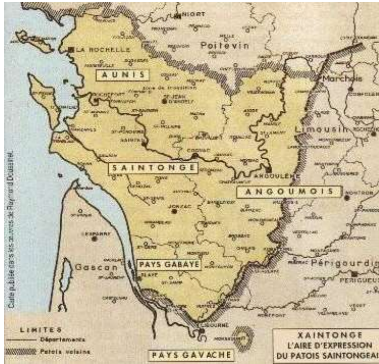
Aire géographique de la langue saontongaise et sa variante le gabaye

Va tau coume thieu ? Alors, éboujhez-vous in p'tit, et seuguez-nous.