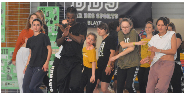
Une ambiance au top avec Citadance.